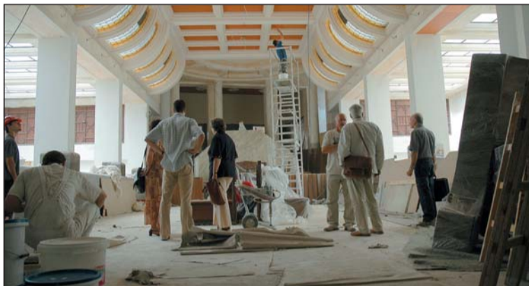
Vedení městské části na jedné z pravidelných „inspekci“ počátkem července letošního roku

Již od počátku rekonstrukce musela být řešena dvě závažná omezení. Prvním bylo to, že v sousedním domě na nám. Míru 19 sídlí Speciální školy pro zrakově postižené. Stavba by mohla rušit jejich provoz, takže bylo potřeba upravit časový harmonogram bouracích prací. Další velkou komplikací byla dispozice stavby v centru – bylo velmi obtížné skloubit plynulý odvoz sutin s dovozem a vykládkou nového stavebního materiálu,