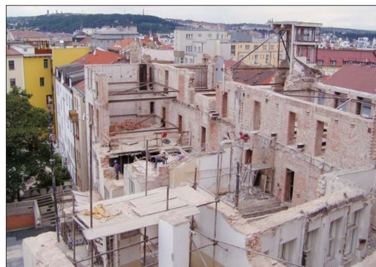
V této fázi si málokdo dokázal v troskách představit budoucí moderní radnici

což si vyžádalo vytvoření přesného časového harmonogramu přistavování nákladních aut, takřka po hodinách. Ohlídat a zajistit proti poškození se ve spolupráci s památkáři samozřejmě také musely historické stavební prvky, což jsou dva sály ve stylu art déco v Jugoslávské.