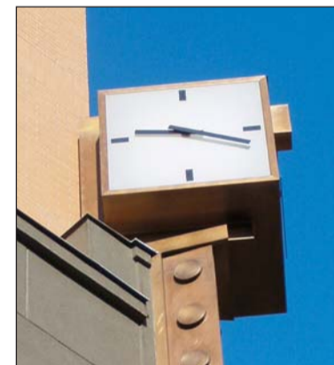
Velké hodiny na rohu budovy nejsou žádnou novinkou: postupem času po nich však zbyl jen mosazný podstavec. Nyní je na nároží osazen moderní hodinový stroj ve stylu art déco, který funguje podle signálu z rozhlasu.