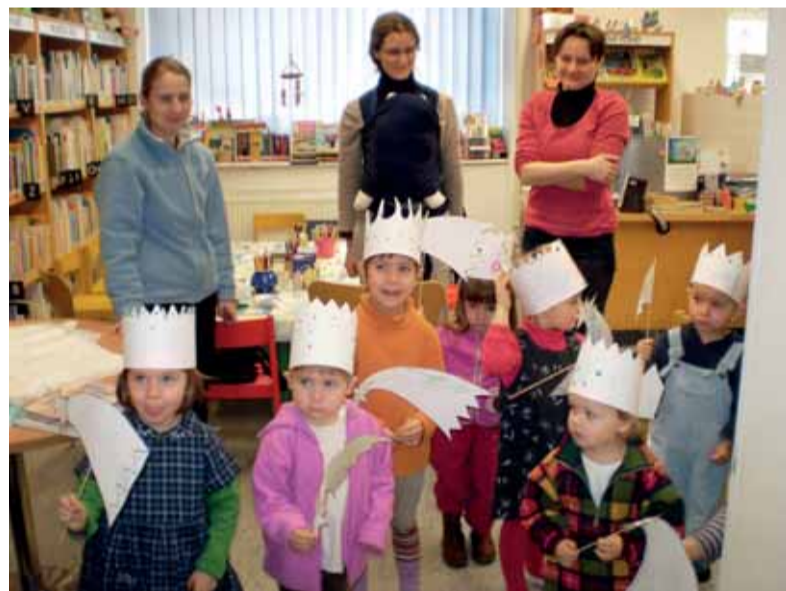
PRO MALÉ ČTENÁŘE: V pobočkách Městské knihovny Praha připravily hodné tety knihovnice v únoru pro nejmenší návštěvníky zajímavé pořady. Tak například v pobočce Dittrichova jsou pro děti na 9. a 23. 2. od 10:15 přichystány další dvě výtvarné dílny s pohádkou Ovčí kapsička ; v pobočce Záhřebská se 16. 2. v 17:00 koná podvěrní zastavení S královnu Koloběžkou za Fimfárem nad pohádkami Jana Wericha . Na snímku děti při Tříkrálovém setkání v pobočce Dittrichova. red

V pátek 5. 2. a 19. 2. v 19:00 se na vás těší kapela HVĚZDNÝ PRACH .