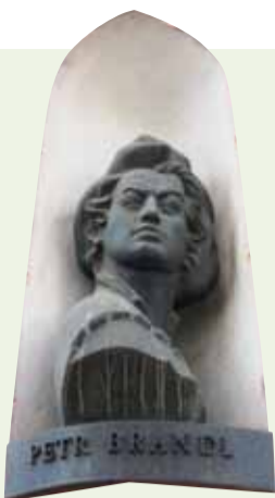
Ve které ulici Prahy 2 nalezneme niku s pamětní deskou Petra Brandla?