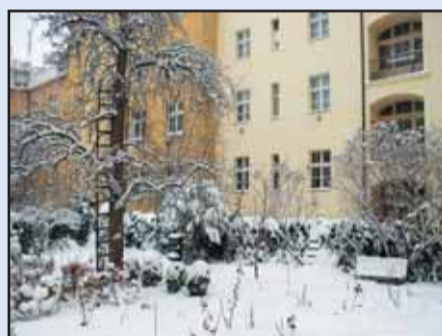
„Zimní zahrada“ v Moravské 28