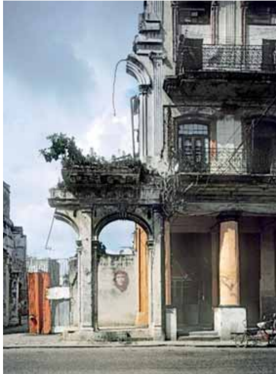
Z cyklu A. Marcose „Na Kubě“

Na území Prahy 2 najdeme významné instituce, které jsou prostředníky mezi pražskou kulturní obcí a zahraničím. Jednou z takových je Institut Cervantes, jehož pražská pobočka kulturu a jazyk španělsky mluvících zemí šíří v Čechách již pátým rokem. O renezanční česko-německého kulturního společenství zase usiluje Pražský literární dům autorů německého jazyka.