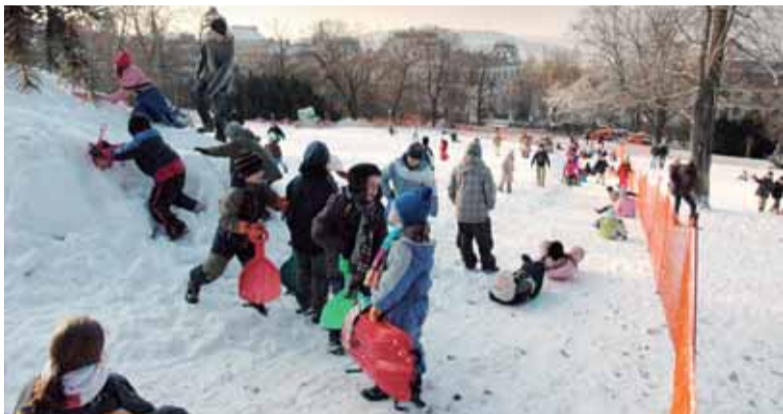
Radostnější stránka zimy – v této chvíli zatím „jen“ na umělém sněhu

Vyrobil technický sníh v centru hlavního města není tak jednoduché, jak by se na první pohled mohlo zdát. Podmínky jsou zde obvykle mnohem horší, než na horách, nebo dokonce než na okrajích Prahy. Je tu tepleji a rovněž voda v rozvodné síti města má o několik stupňů vyšší teplotu, než je optimální. Proto i technika na výrobu sněhu, pokud hodně nemrzne, musí mít dostatečnou kvalitu a kapacitu, což je dosti nákladné a může si to v případě menších mrazů dovolit jen sponzorovaná akce.