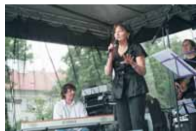
Svatojanská pouť na Karlově nám.

Ve výčtu kulturních akcí nesmí chybět ani pestrá a stále se rozšiřující činnost Novoměstské radnice, příspěvkové organizace zřízené městskou částí. Jmenujme alespoň nejúspěšnější výstavy: Obrázky Ivy Hüttnerové, Jak se točí Fimfárum, Křehká krása stříbrného skla, Hry a klamy, výstavu českého komiksu a další zajímavé akce, jejich výčet by vydal na samostatný článek. Nyní se zde konají výstavy Zpráva o akci K a Vzácné dědictví, prodloužená byla Minulost lékařství a léčitelství. Od 17. února bude otevřena unikátní putovní výstava Škaredá středa - nálet na Prahu 14. 2. 1945. Mnoho zajímavých akcí pořádá i naše další příspěvková organizace, Knihovna na Vinohradech. Z těch nejvýdaňnějších je možné uvést, kromě soutěží či besed, zapojení do celonárodního projektu Kniha mého srdce nebo Velké říjnové společné čtení pohádek Boženy Němcové. Knihovna má více než tři tisíce kmenových čtenářů, kteří mohou kromě knihovního fondu a služeb studovny využívat také internet.