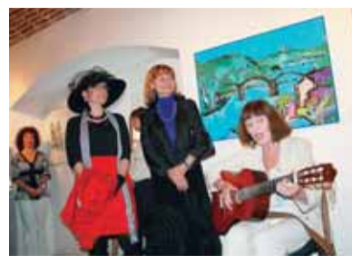
Setkání Praha - Řezno na Vyšehradě

Důležitou součástí kulturní politiky městské části jsou veřejné finanční podpory, známé jako grantový systém. V roce 2009 bylo ze čtyřiceti řádně podaných žádostí podpořeno dvadřacet projektů. Kromě tradičních, jako např. Jarmark u Ludmily, výstava