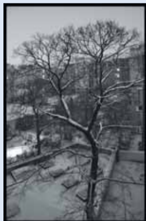
Vnitroblok Francouzská 25