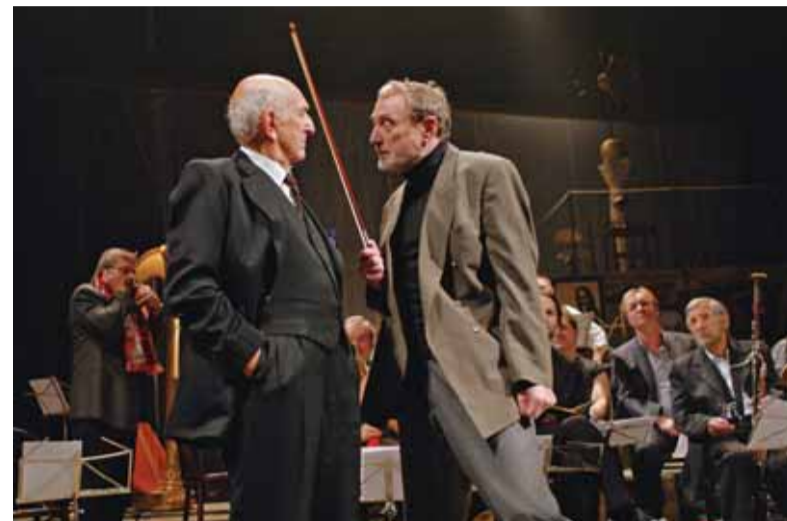
Zkouška orchestru měla úspěšnou premiéru na podzim

Poslední premiérou sezony 2008/2009 byla komedie Mumraj od Lea Birinského. Hra pochází ze začátku 20. století, autora k jejímu napsání inspirovaly revoluční události v Rusku v roce 1905. Díky neobyčejně vtipné a překvapivě zápletky neztratila hra ani po stu letech nic ze svého komediálního náboje. Titulní role vytvořili v režii I. Rajmon-