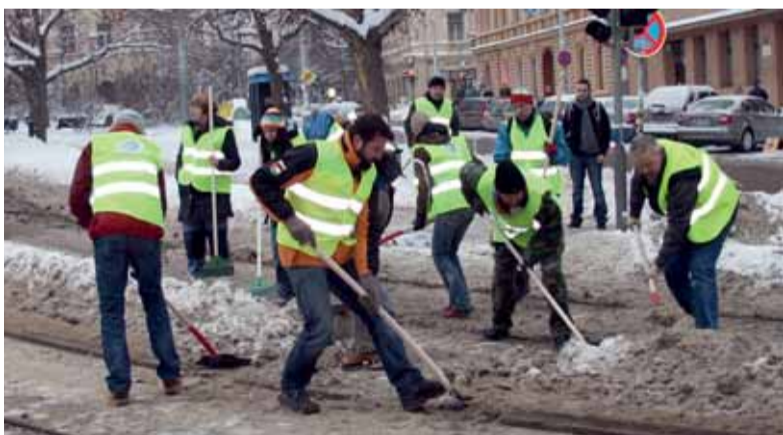
Zaměstnanci úřadu městské části odklízejí sníh z kolejí na náměstí Míru