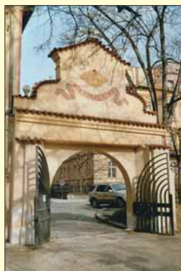
Kde můžeme v Praze 2 vidět sluneční hodiny, zachycené na tomto snímku?

Kino MAT na Karlově nám. 19 (vchod z ulice Odborů) bude v dubnu promítat např. anglicko-francouzský romantický film Pýcha a předsudek , anglicko-americký thriller Match Point – Hra osudu , rodinnou českou komedii Jak se krotí krokodýli , francouzské drama Doo Wob nebo německý válečný film Devátý den . Děti se mohou těšit na pásmo pohádek Perníková chaloupka , komedii Anděl páne nebo na americký animovaný film Karoolka . red