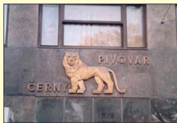
Na které náměstí se dívá lev, umístěný na průčelí tohoto domu?