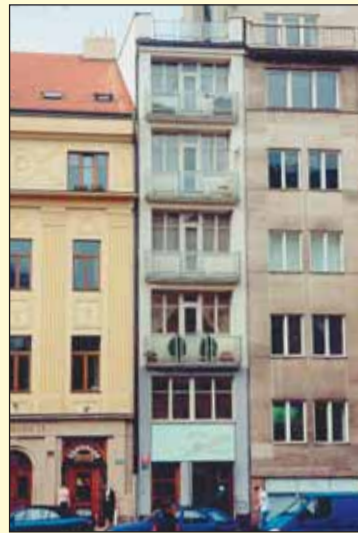
Ve které ulici Prahy 2 stojí velmi úzký dům čp. 573?

Kino MAT na Karlově nám. 19 (vchod z ulice Odborů) promítá v únoru z produkce ČR např. smutnou komedii Ještě žiju s věšákem, plácačkou a čepicí, drama Restart, dokument Chačipe nebo pohádku Anděl páně. Pro milovníky napětí je připraven americko-německo-novozélandský velkořím King Kong nebo americký sci-fi film Stopařův průvodce po galaxii. Děti se mohou podívat na rodinnou komedii Letopisy Narnie: Lev, čarodějnice a skříň, pásmo pohádek Na návštěvě u Spejbla a Hurvínka I., na příhody dvou neapravitelných kutilů Pat & Mat nebo na hudební pohádku Zlatovláska. Další podrobnosti na: www.mat.cz. red