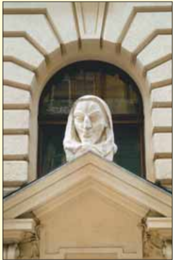
Současné Divadlo v Vinohradech se v letech 1950 – 1966 postupně jmenovalo Divadlo československé armády, Ústřední divadlo československé armády a opět Divadlo československé armády