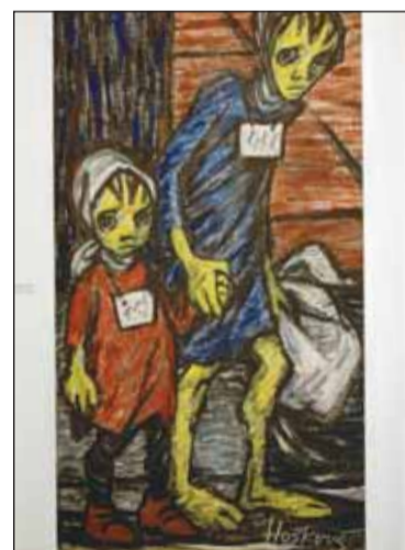
Helga Weissová-Hošková: „I děti...“

● Dětské odpoldní pořady (každou středu od 14:00): Únorová pohádka (8. února); Zimní soutěžení (15. února); Pohádkový semafor – představení Černého divadla (22. února). ● Filmové čtvrtky (od 17:00): Příběh rodiny Mukových v černé komedii Dobla (16. února). ● Výstavy: Fotografie Roberta Halamička Zrcadlení (od 1. února do 5. března). Místa utrpení, smrti a hrdinství – vězni z českých zemí v nacistických koncentračních táborech (do 19. března). Případ relikviáře svatého Maura – o průběhu pátrání a o nálezů této unikátní románské památky (do 31. března). Výběr z výstavy Prostitute staré Prahy (stálá výstava). Expozice je otevřena denně kromě pondělí od 10:00 do 17:00. ● Internet: www.mvcr.cz/muzeum, tel.: 974 824 862.